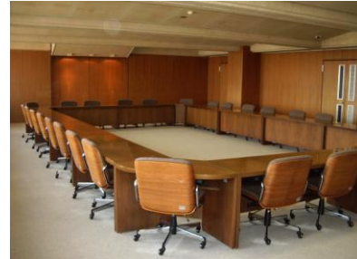
特別会議室…会議、研修会・講習会などに御利用いただけます。