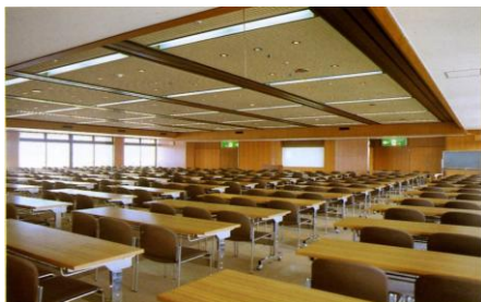
10F 大会議室…会議、研修会・講習会のほか、企業 PR・商品発表会などの販売促進活動の会場としても御利用いただけます。