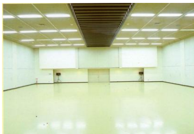
2F 展示ホール…OA 機器、家電製品の展示会や呉服等の販売、及び文化・芸術活動の発表会場として御利用いただけます。